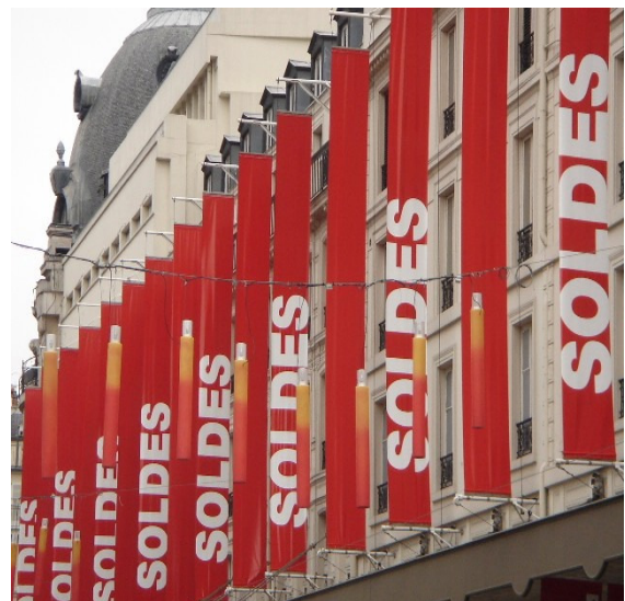
Parigi al tempo dei saldi

Una tentazione che abbiamo sempre avuto è quella di apostarci davanti a un negozio di abbigliamento (o di pentole, o di libri) il giorno in cui, due volte all'anno, i commessi affiggono alle vetrine annunci molto vistosi come "Da domani saldi. Tutto al 30, 50, 70 per cento in meno". Ci piacerebbe intervistare i clienti che entrano lo stesso il giorno prima, discutere con loro, mentre provano un vestito, le teorie neo-classiche che li suppongono perfettamente razionali e accompagnarli infine alla cassa mentre vanno a pagare tranquilli e consapevolmente il prezzo pieno quando poche ore dopo potrebbero pagare la metà o portare via due vestiti invece di uno.