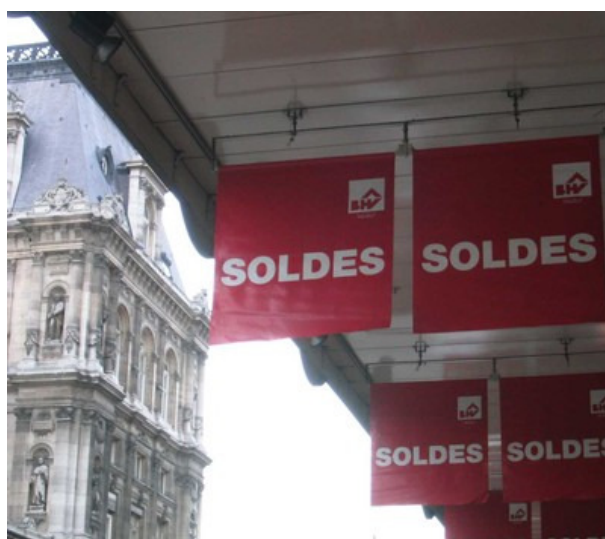
Saldi a Pargi. Sullo sfondo il Municipio

Fuor di metafora, gli schizzi sul pavimento rappresentano piccole aree di iniziale surriscaldamento di alcuni asset. Si tratta soprattutto delle case (più che delle borse) in Cina, a Hong Kong, Singapore e Australia. Per asciugare gli schizzi e prevenire la formazione di bolle si lavorerà di fino, in Asia, con piccoli ritocchi sui tassi, con rivalutazioni dei cambi se verrà confermata una ripresa delle esportazioni e con i nuovi strumenti di precisione macroprudenziali