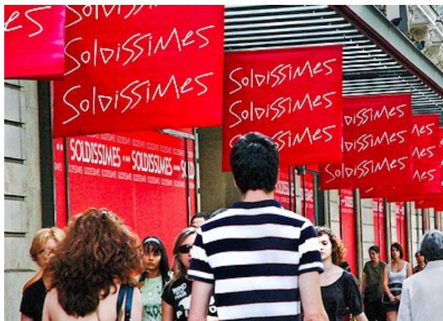
Saldissimi in Boulevard Haussmann

Andiamo piano quindi a dire che la ripresa dell'economia è già finita e che senza sostanze psicotrope più o meno lecite si tornerà presto in recessione. La ricetta medica per queste sostanze verrà presto rinnovata dal Congresso, che riaprirà il piano di incentivi per le case. Quanto alle auto, i dati di ottobre, stando all'ufficio studi di General Motors, saranno già migliori di quelli di settembre. Anche un commesso di negozio vi spiegherà, senza scomodare un guru del marketing, che dopo i saldi c'è un paio di settimane in cui si lavora poco ma poi la vita riprende il suo corso. Succede perfino in tempo di guerra.