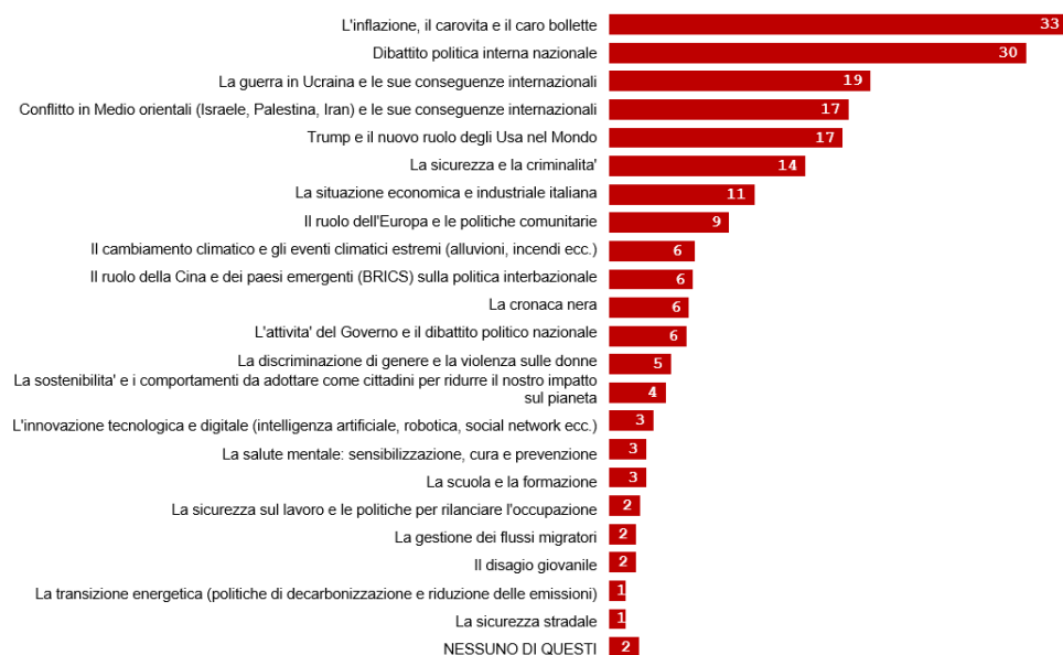
GRAFICO 1 - Risultati ricerca tra l'1 e il 2 marzo 2026 sui temi rilevanti (valori espressi in percentuale) In questi primi mesi del 2026 quali sono stati i temi informativi che ti hanno più interessato? (Massimo 3 risposte)

Il sondaggio* condotto dai ricercatori dell' Università Cattolica , in collaborazione con l'istituto di ricerca Bilendi , rivela che per il 33% degli italiani il tema informativo di maggiore interesse nei primi mesi del 2026 è l'inflazione e il caro vita , seguito ( 30% ) dal dibattito su politica interna nazionale . Al terzo posto, ma con un evidente scarto, i conflitti in Ucraina (19%) e in Medio Oriente (17%) (grafico 1).